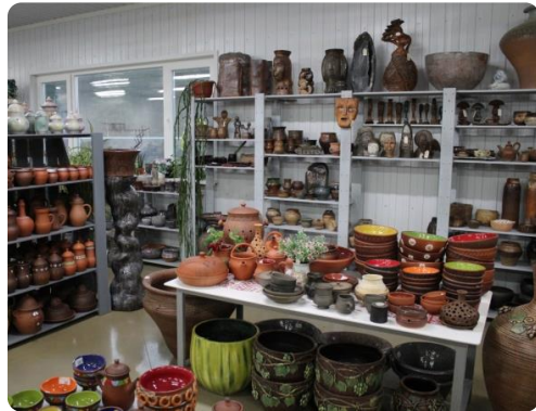
Гончарное производство «Сады Аурики»