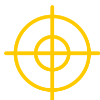
Для охоты и рыбалки